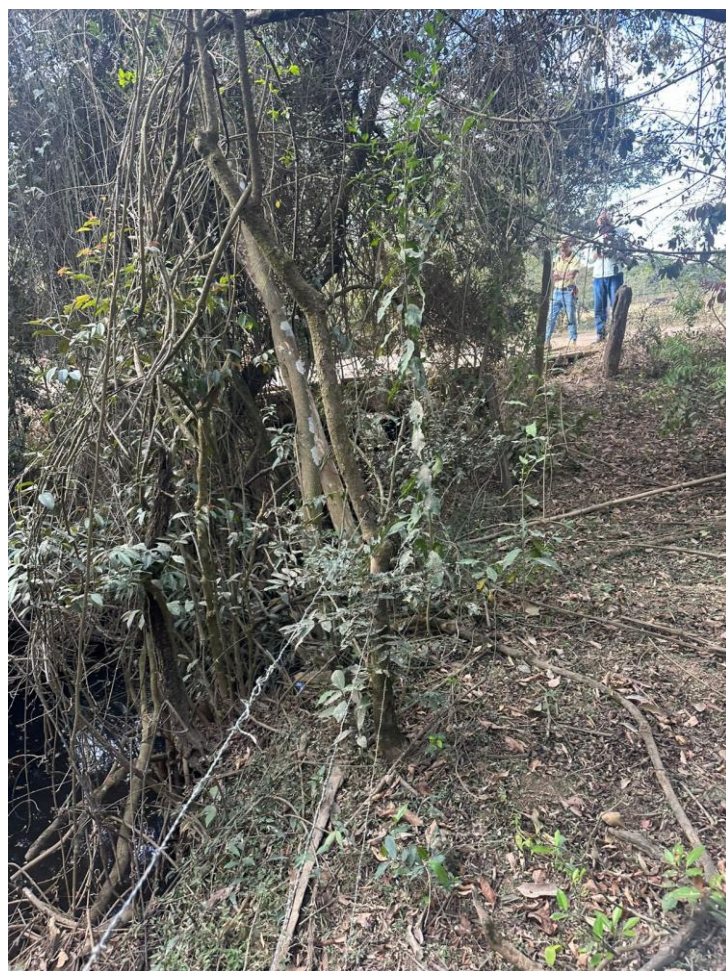
Descrição: Local da Ponte