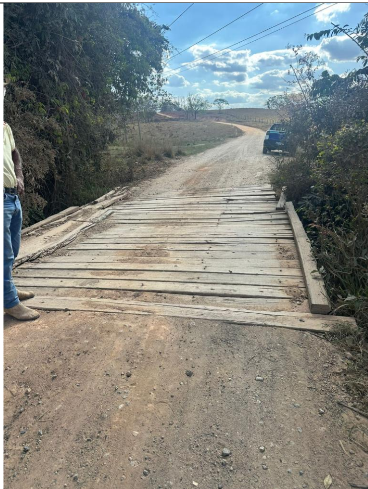
Descrição: Ponte Existente